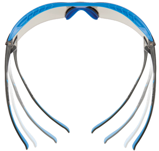
Tecnología de Difusión de Presión de 3M™.